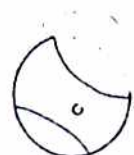
ボールと手のひらの隙間がない ×