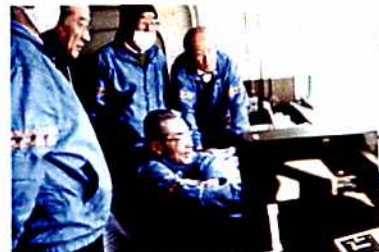
リニューアルされたスコアボード用 CPU の勉強会 事務局本部