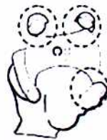
親指が真ん中に入っていない。正しい目線種と握る位置が違う ×