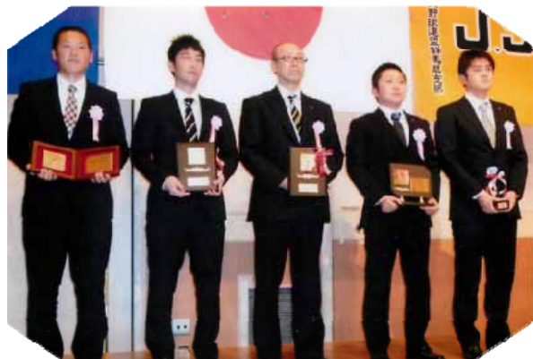
新人賞・荣誉賞・笹治賞